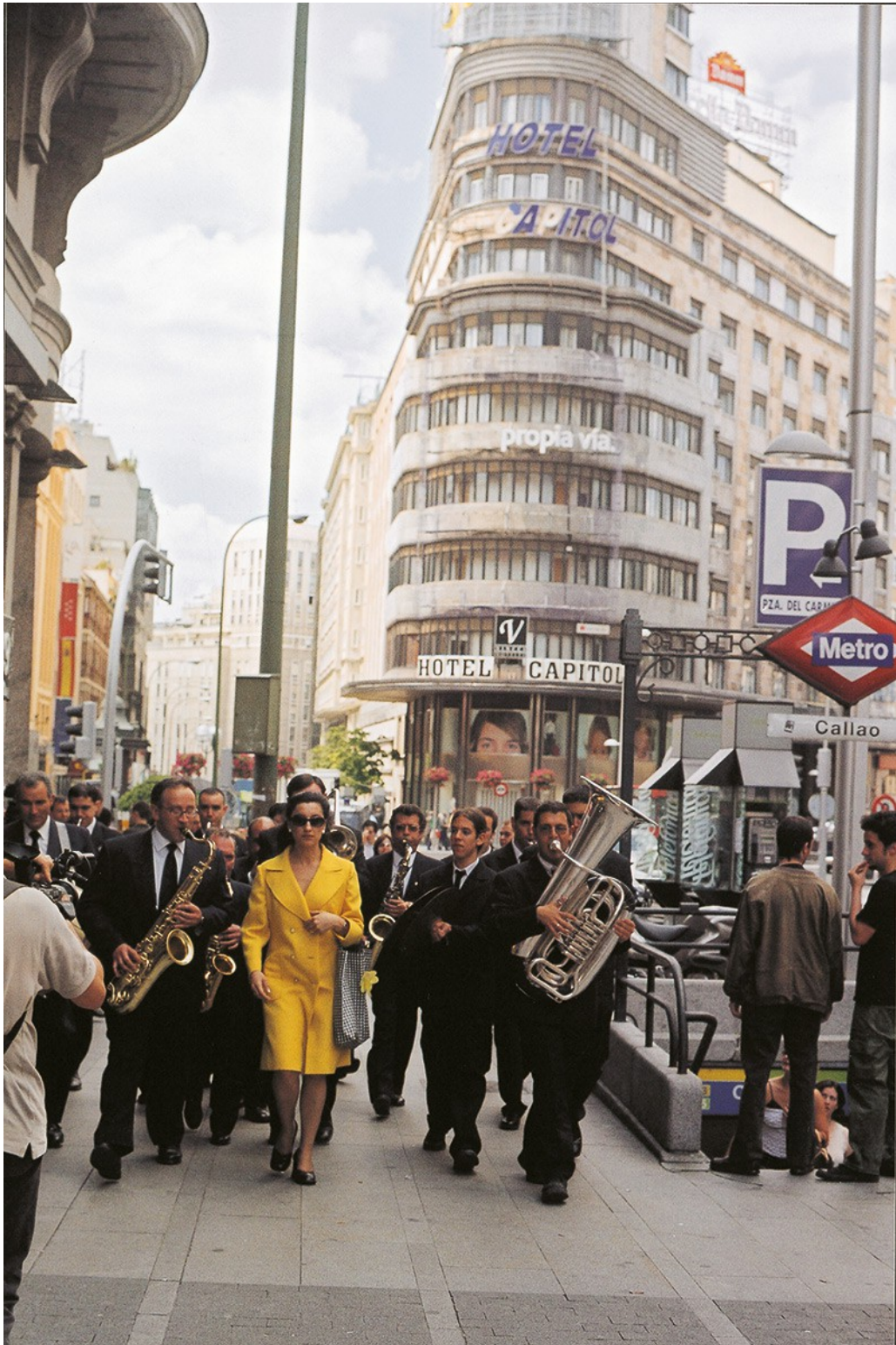
Viva España , 2004. Acción, Documentación videográfica © Pilar Albarracín