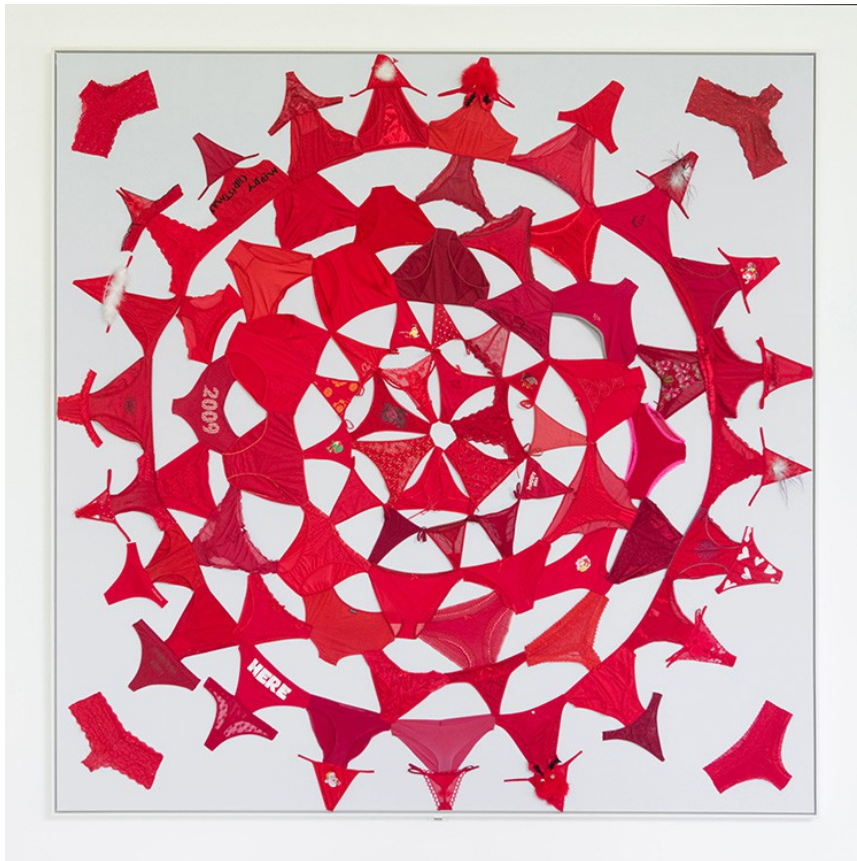
Mandala , 2012. Bragas usadas rojas sobre lienzo. 289 x 289 cm © Pilar Albarracín