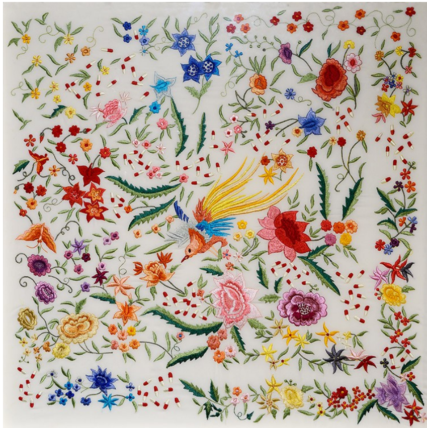
Paraísos artificiales , 2001. Bordado de seda sobre seda. 80 x 80 cm © Pilar Albarracín