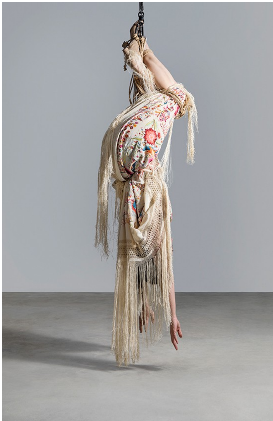
A point. Serie Carne y tiempo , 2018. Fotografía color. 195 x 127 cm © Pilar Albarracín