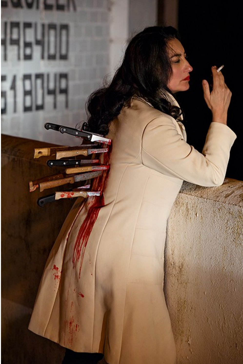
No comment , 2018. Fotografía color. 195 x 127 cm © Pilar Albarracín